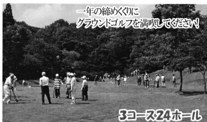
一年の締めくりに グラウンドゴルフを満喫してください!