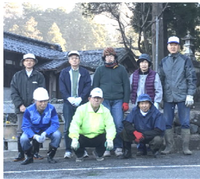
きれいな花が上原神社前を彩る事になります。

12月7日(木)、班長さんらに協力をいただき、上原神社前の花壇に大垣市より支給されたパンジーの苗植え付けを行いました。