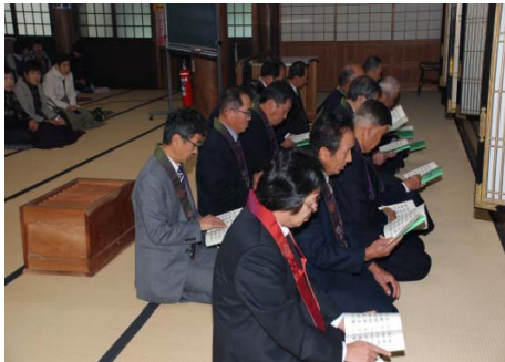
報恩講の助音方、現在も門徒の皆さんにより継承されています。11月23日撮影

上原浄徳寺報恩講が十一月二十一日から二十四日まで行われ、例年通り浄徳寺門徒の皆さんによる、報恩講の助音方が勤められました。