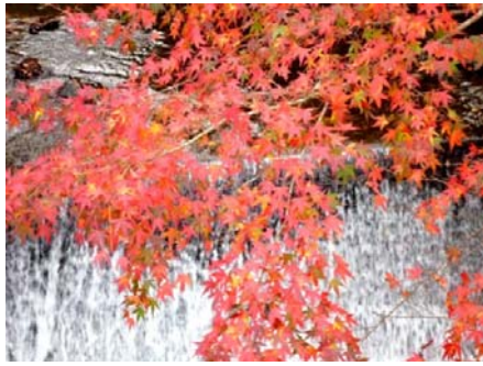
三谷川のもみじも後半の暖かい日が続き、紅葉の鮮やかさは今ひとつでした。

恒例の多良峡もみじ祭りが、十一月二十一日(日)に多良峡森林公園にて開催されました。イベントの裏方で、もみじ苗の植樹など、上原区からも数名の方がボランティア参加頂きました。お疲れ様でした。