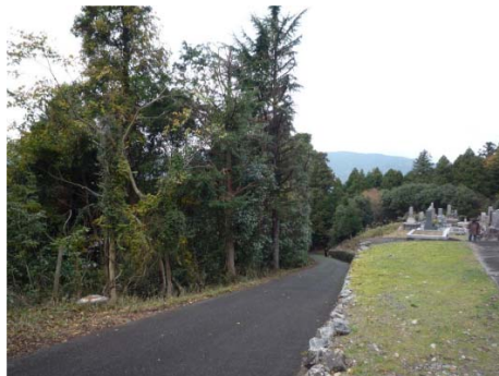
木の枝払いで明るく、また大洞林道と墓道が舗装したように綺麗になりました。

太陽光発電所周辺の樹木枝払い、及び道路の高圧洗浄が、イビデン様によって行われ、大洞林道や上原墓地付近が明るくなりました。作業期間中(十一月二十一日～二十二日)通行等ご不便をお掛けしました。