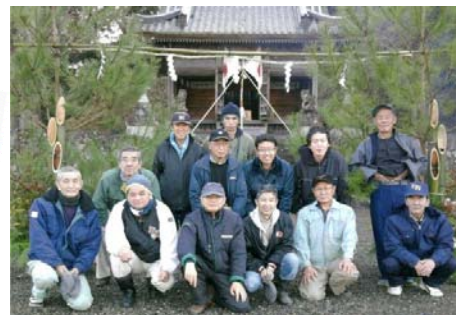
年末年始は穏やかな天候に恵まれ、多くの方に参拝いただきました。中組の皆さん正月の準備や宮守等ご苦労様でした。

が猿の群れに食い荒らされる被害が発生しましたが、きれいに修復され、無事に正月を迎えられました。参拝された方にはお神酒と暖かい甘酒が振舞われました。