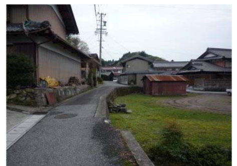
同箇所は、これまで強引に通るトラックを見かけましたが、拡幅後は緊急車両が安全に通行できるようになります。