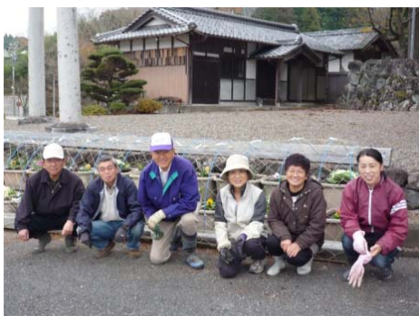
参加された班長の皆さん。草取りなど事前に準備がされており、約1時間できれいな花壇に仕上がりました。

花いっぱい運動の一環として、十二月十二日(土)朝八時から、班長さんらに協力をいただき、上原神社前の花壇に、大垣市より支給された葉ボタンとパンジーの苗の植え付けを行いました。作業いただいた皆さまお疲れさま様でした。