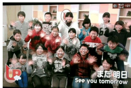
今日のデイリーUPのエンディングで手を振る多良小5年生の皆さん。